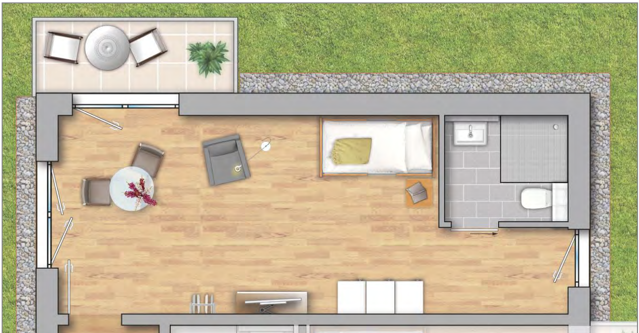
Beispielgrundriss Appartement Typ 2

Typ 2 (Appartements 1 und 12) mit ca. 33 m 2 Fläche zzgl. ca. 22 m 2 anteilige Gemeinschaftsfläche