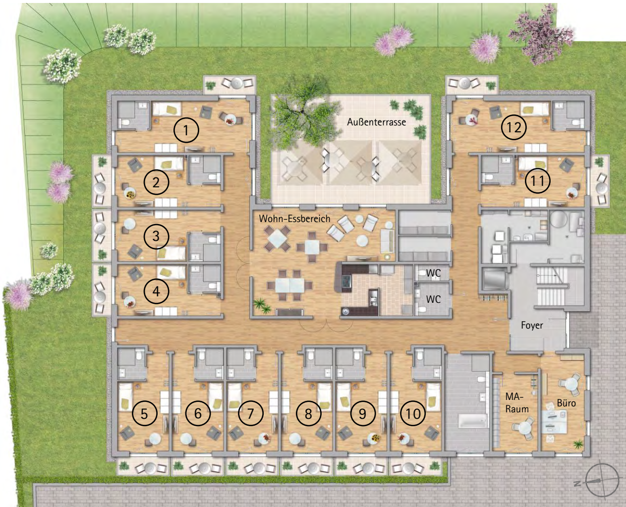
Grundriss ambulant betreute Wohngemeinschaft im Erdgeschoss