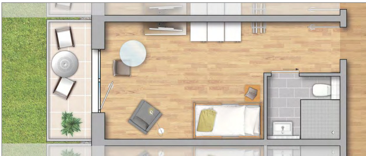
Beispielgrundriss Appartement Typ 1